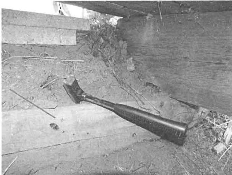
01-2018-HAUFLAGERHOLZ HINTEN VOLLSTÄNDIG VERROTTET