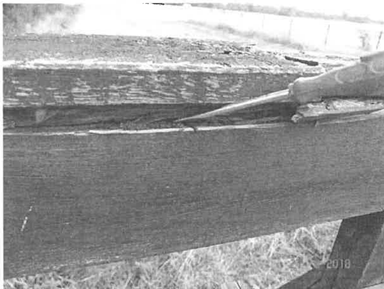
05-2018H-GELÄNDER HANDLAUF LINKS MORSCH UND FÄULNIS VORHANDEN