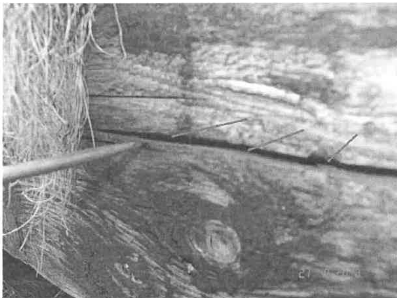
03-2018H-LÄNGSTRÄGER LINKS HINTEN AUßEN PILZ MIT FRUCHTKÖRPER