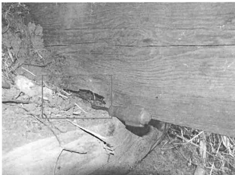
02-2018H-LÄNGSTRÄGER RECHTS HINTEN INNEN FÄULNIS